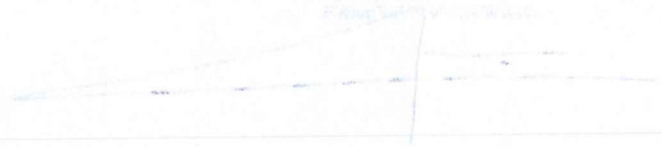
Figure 1: A diagram showing a triangle with a vertical line extending downwards from its base, likely representing a structural element or a measurement.